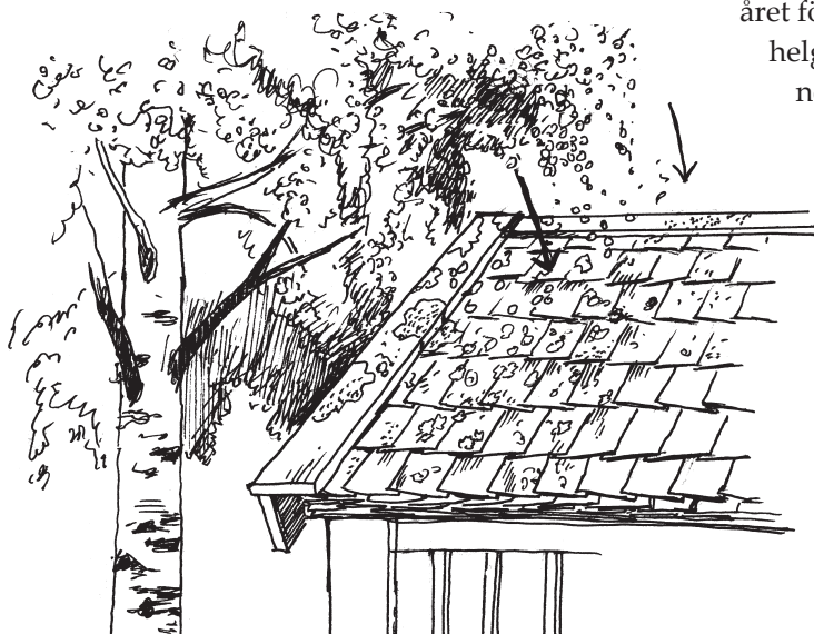
Björkfrön, löv, lavar och mossor förstör träspånen. Ill. Tomas Hultman

Rensopning med piassavakvast någon gång om året förlänger effektivt takets livslängd. Att helgardera sig med en takpapp under spånet fungerar inte eftersom spånet måste ligga luftigt för att torka.